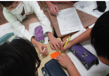
【互いにアイデアを出し合い、難問に挑戦する様子】