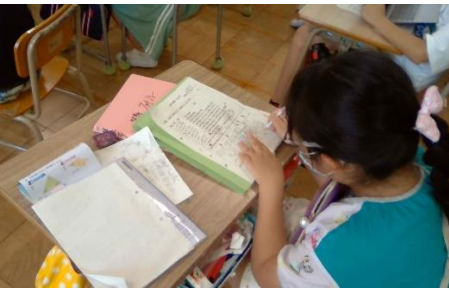
【黒石タイムの計画を立てる様子】