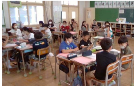
【グループ別に学習する様子】