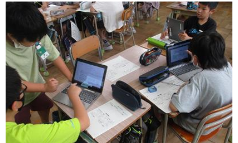
【進度に合わせてQubenaに取り組む様子】