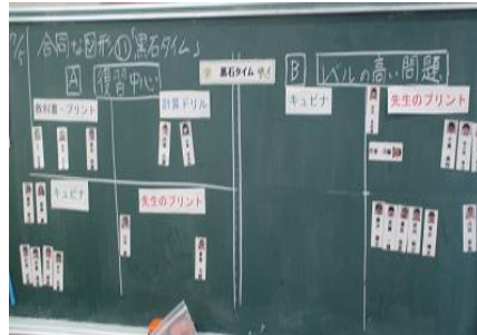
【各自の学習方法を視覚的に捉えられるようにした】