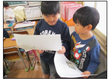
3、クラスの中で自由に